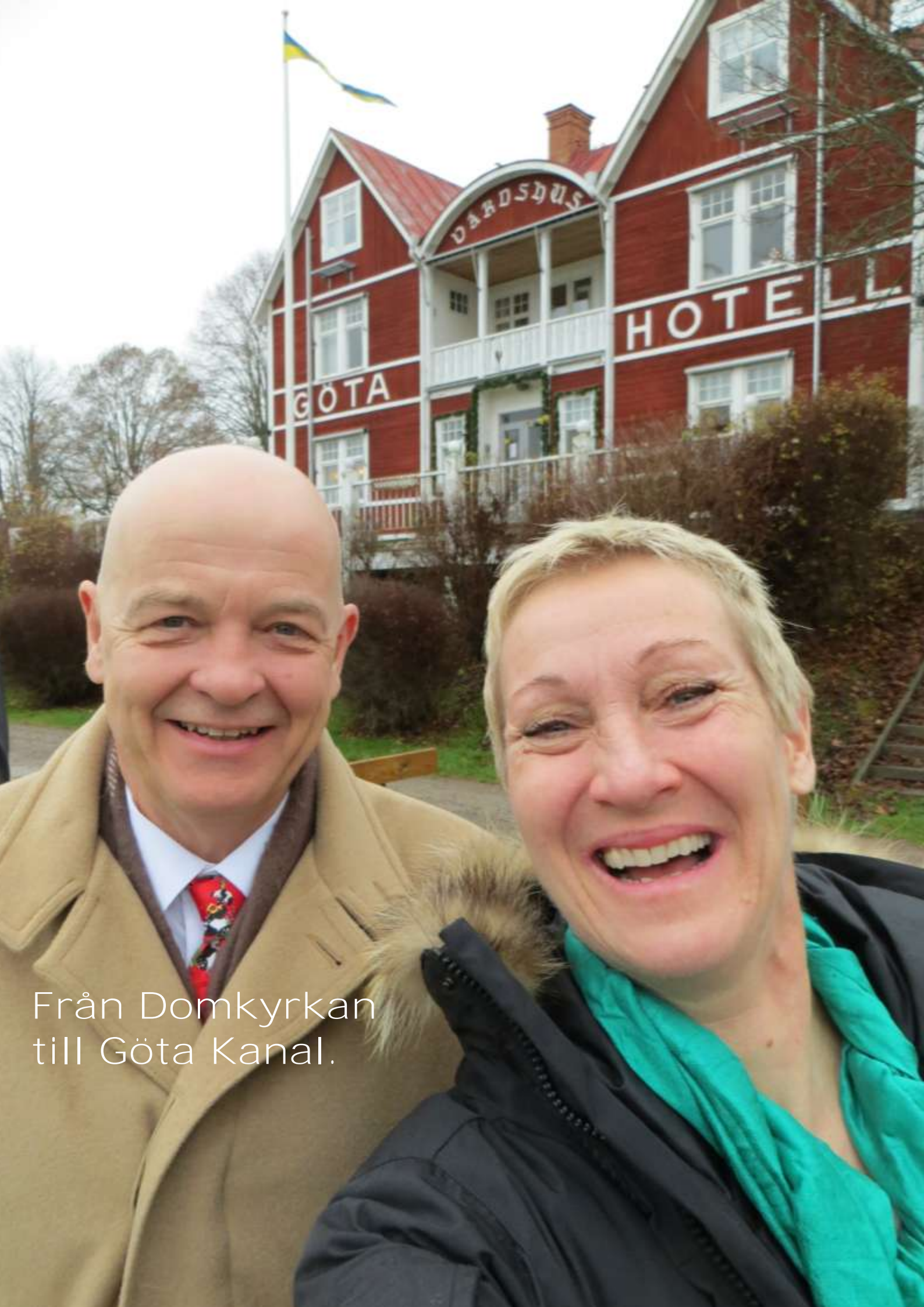
Från Domkyrkan till Göta Kanal.