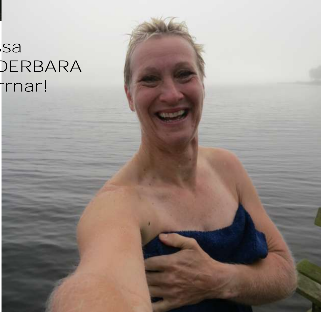
Dessa UNDERBARA mornnar!