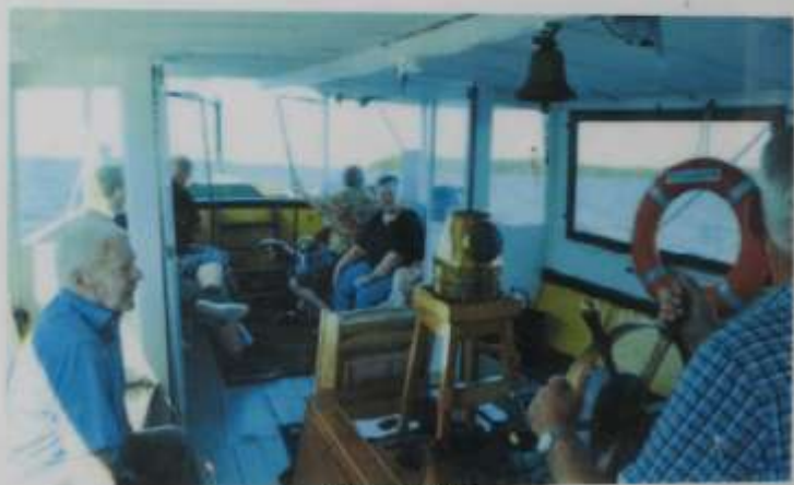
Klacken på väg...

I början av 1900-talet började Iföverken frakta sina råvaror från gruvorna på Ivöns nordspets med pråmar, som drogs av bogserbåtar. De allra första båtarna hette Thor och Axel. Axel hade järnskrov och var åtta meter lång och hade en ångmaskin på 10 hästkrafter. När sjöförhållandena var goda kunde den bogsera två pråmar i taget från Ivö till Iföverken i Bromölla. Thor var byggd i trä. Omkring 1910 bestod Iföverkens bogserflotta dessutom av Delfin, Fram och Elsa. Delfin var utrustad med en encylindrig ångmaskin på 16 hästkrafter. Vid bra väderlek kunde den bogsera fyra pråmar.