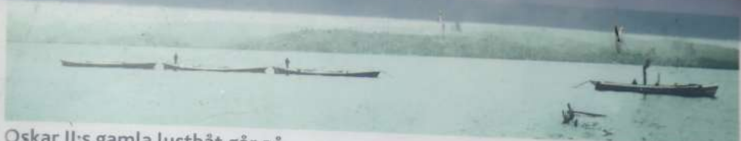
Pråmarna på Ivösjön