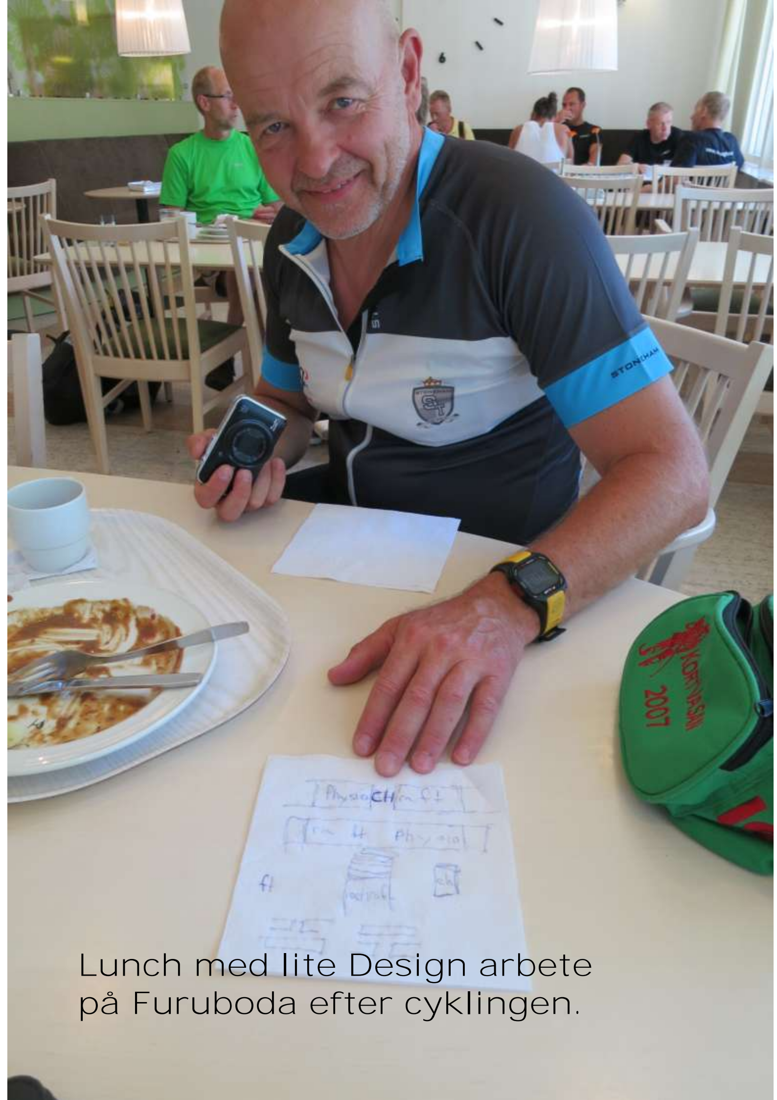
Lunch med lite Design arbete på Furuboda efter cyklingen.