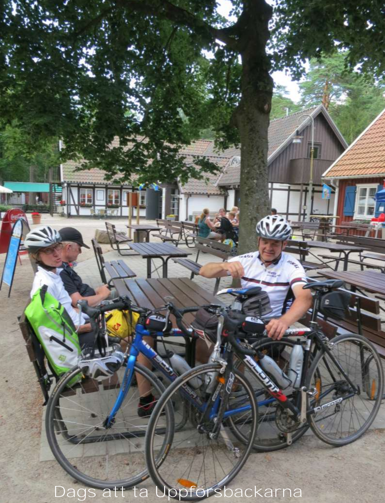
Dags att ta Uppförsbackarna mot Ljungabolet igen!