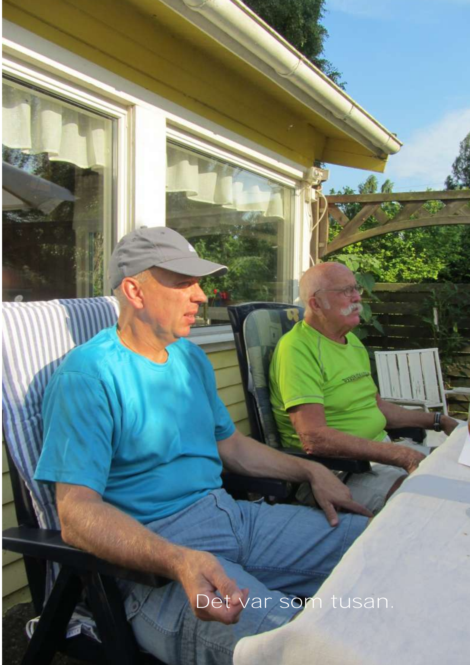
Det var som tusan.