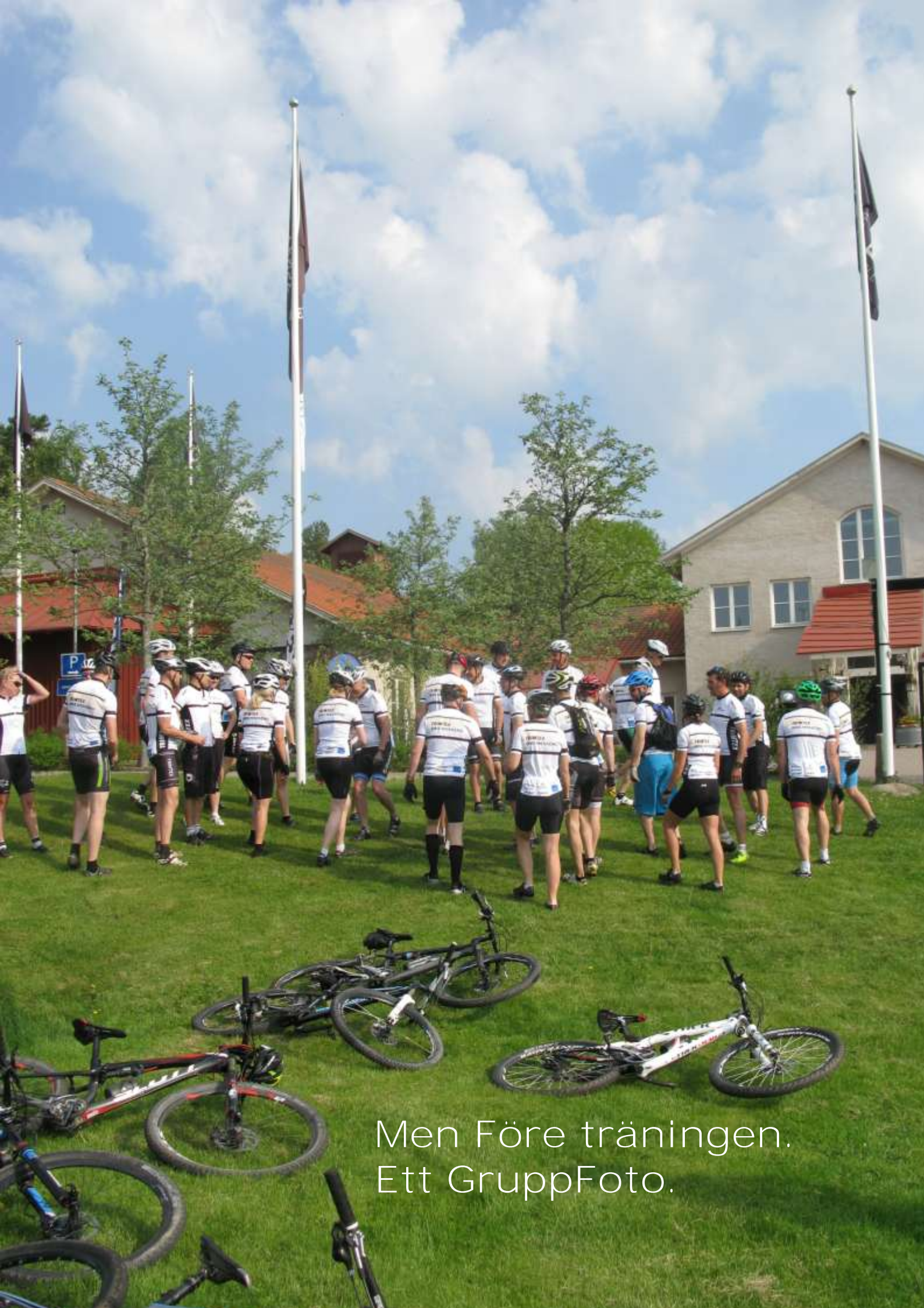
Men Före träningen. Ett GruppFoto.