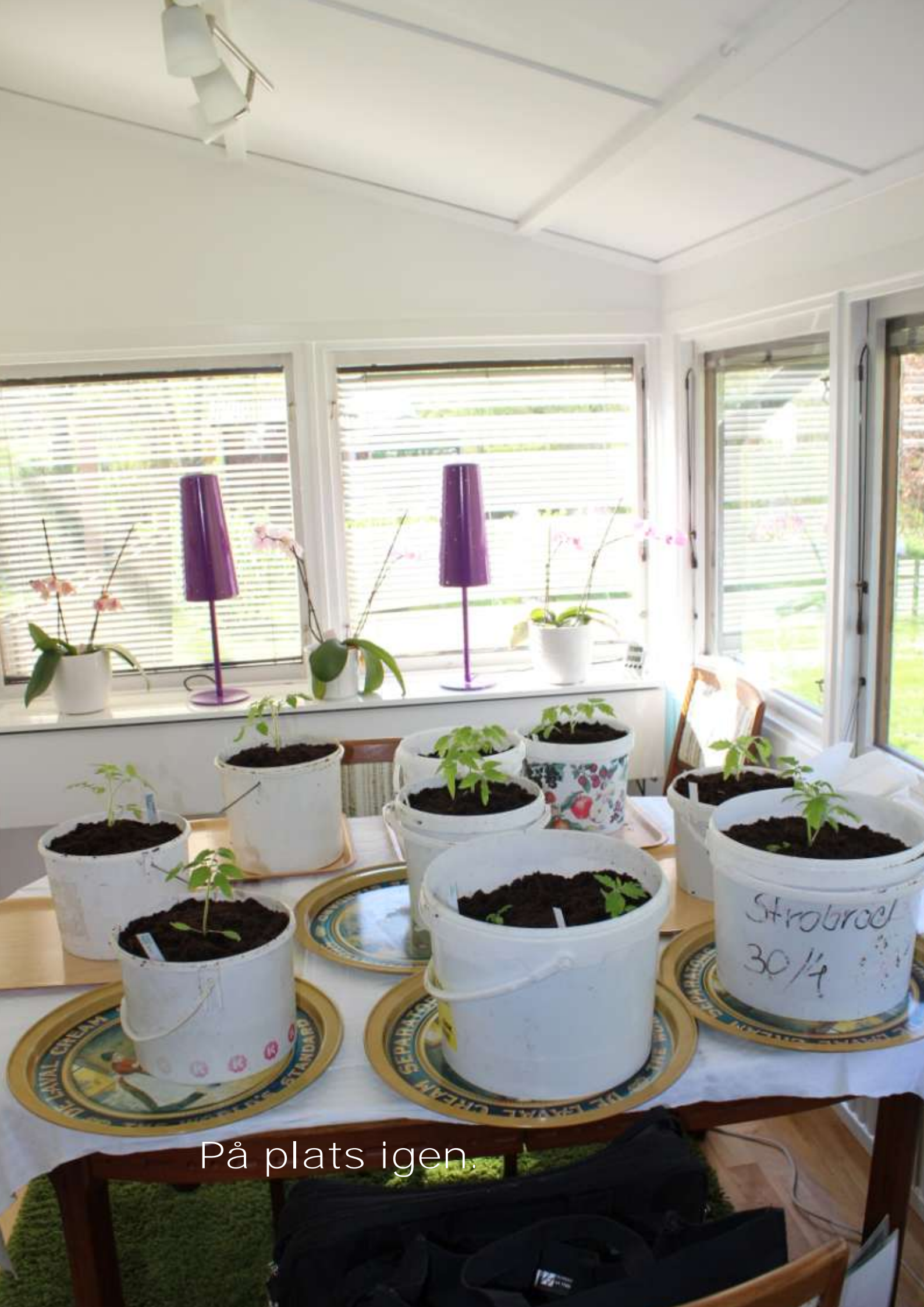
På plats igen.