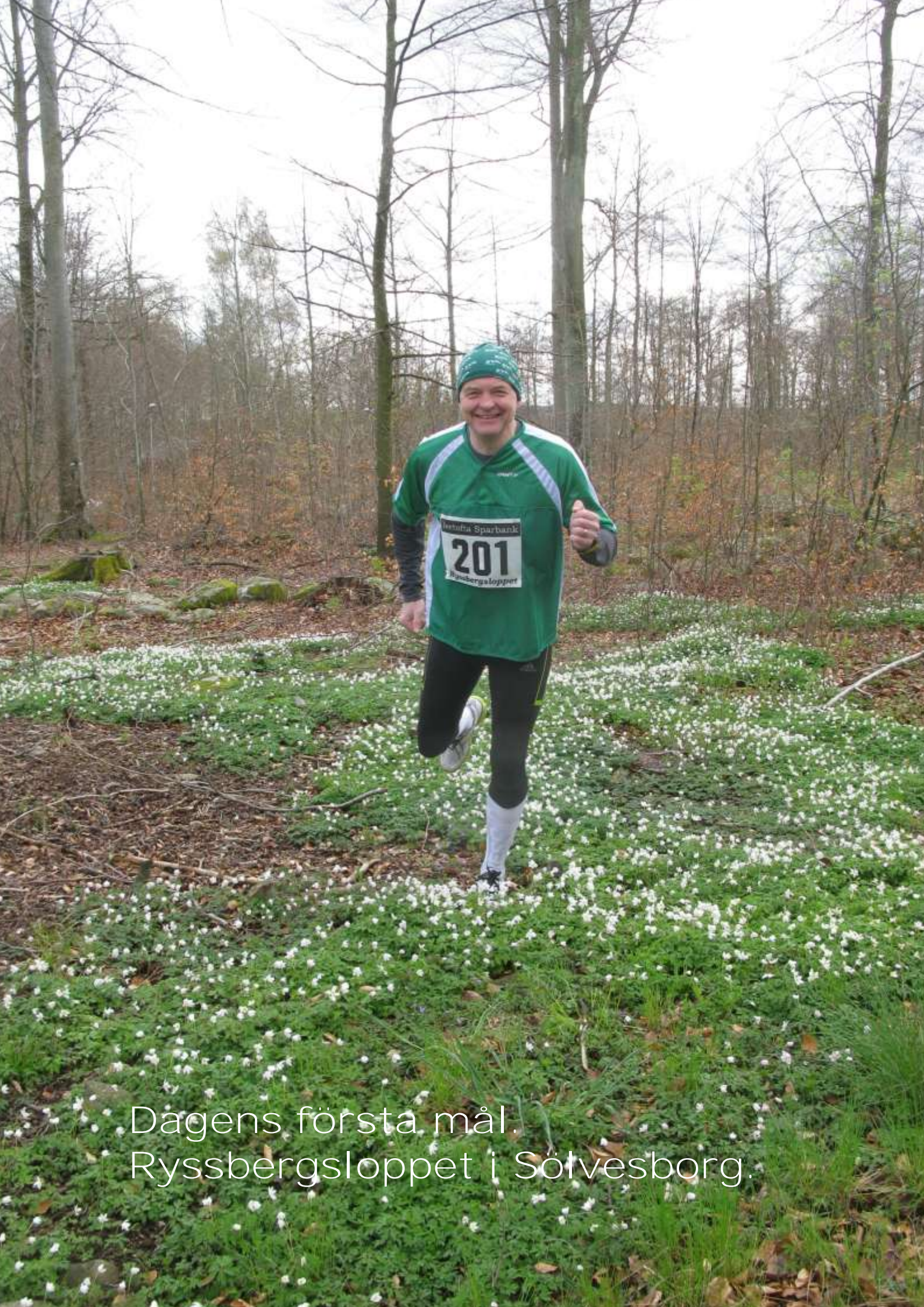
Dagens första mål. Ryssbergsloppet i Sölvesborg.