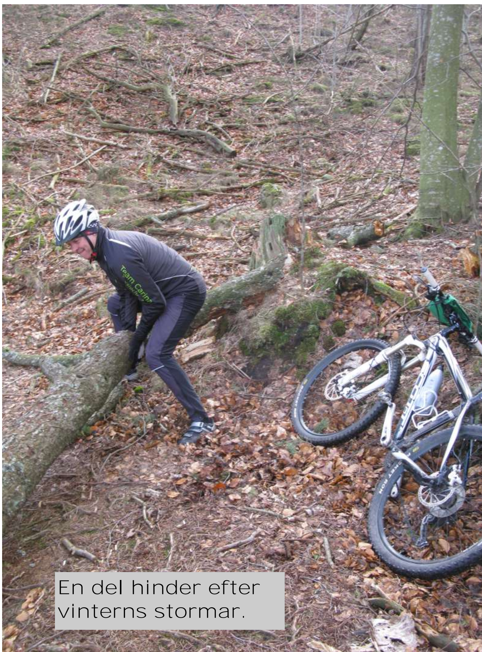
En del hinder efter vinterns stormar.