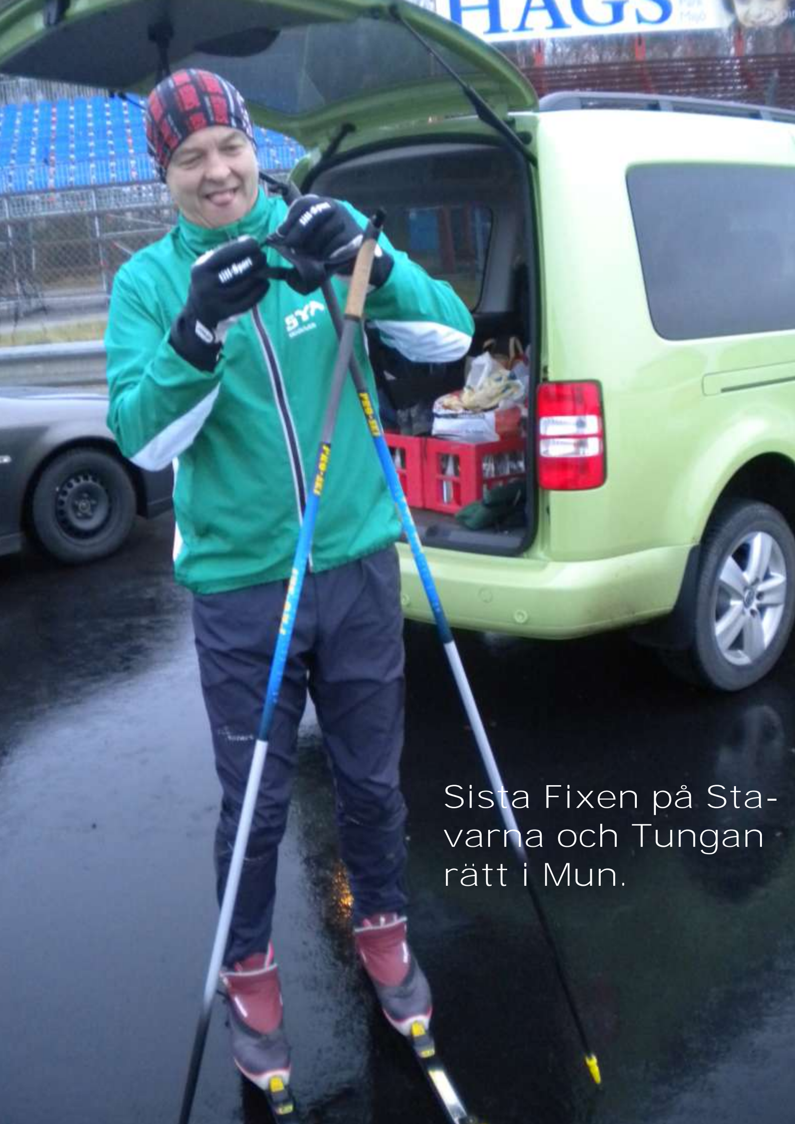
Sista Fixen på Sta- varna och Tungan rätt i Mun.