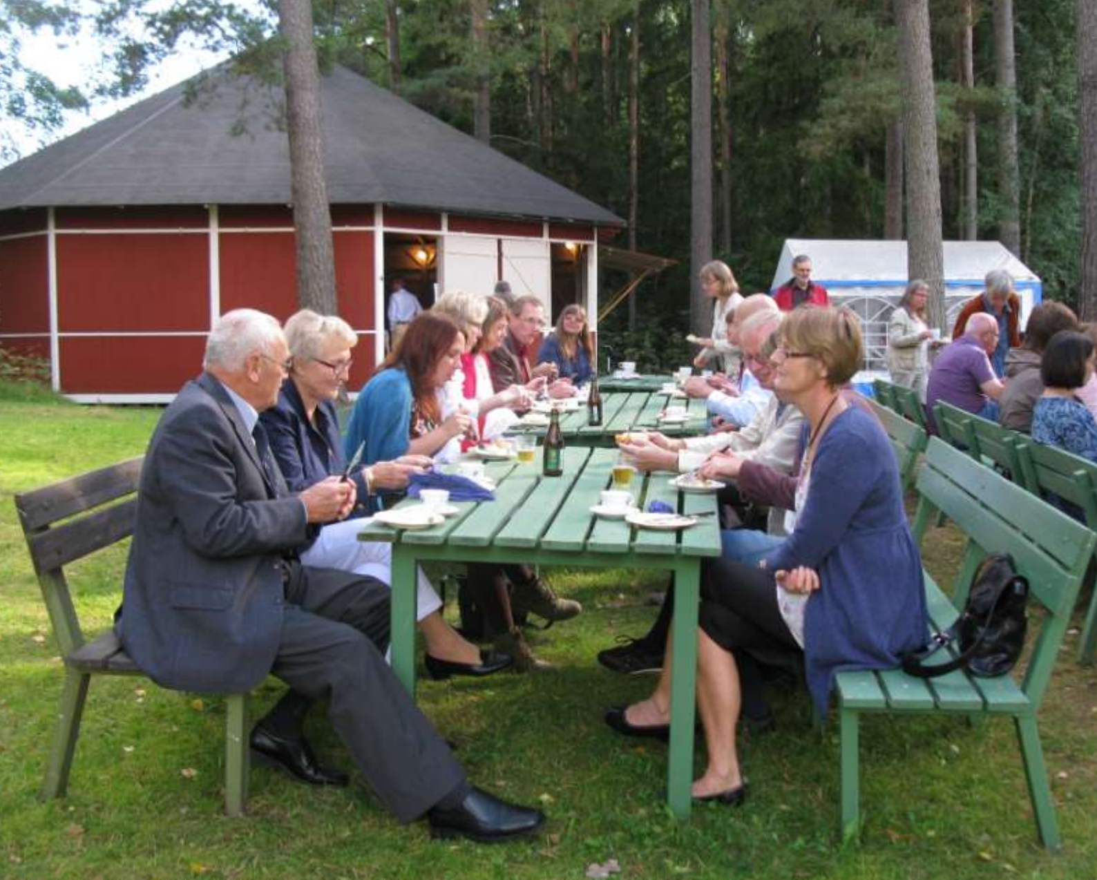
Kalas i Bettna. Bettna är en liten ort med 412 invånare