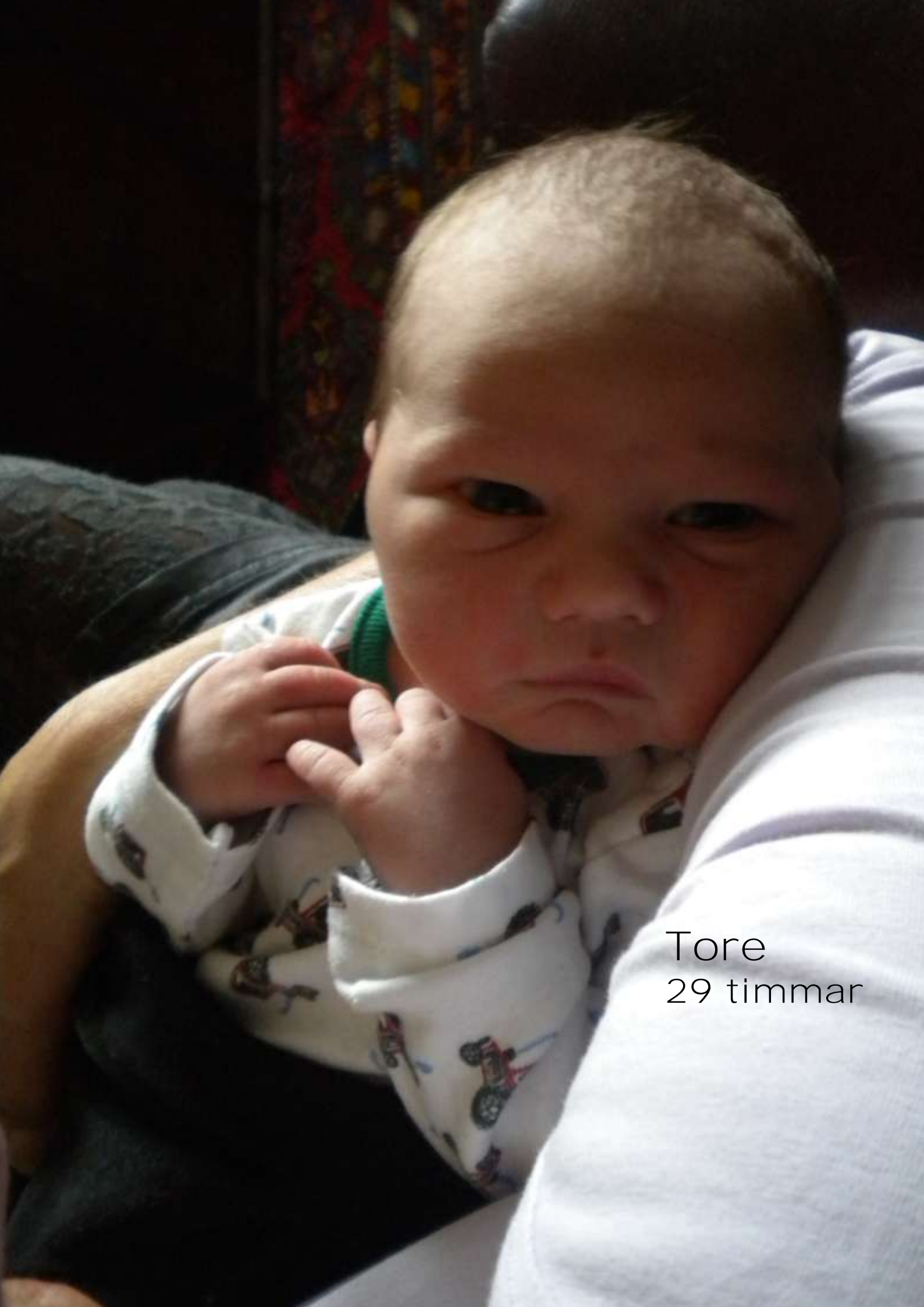
Tore 29 timmar