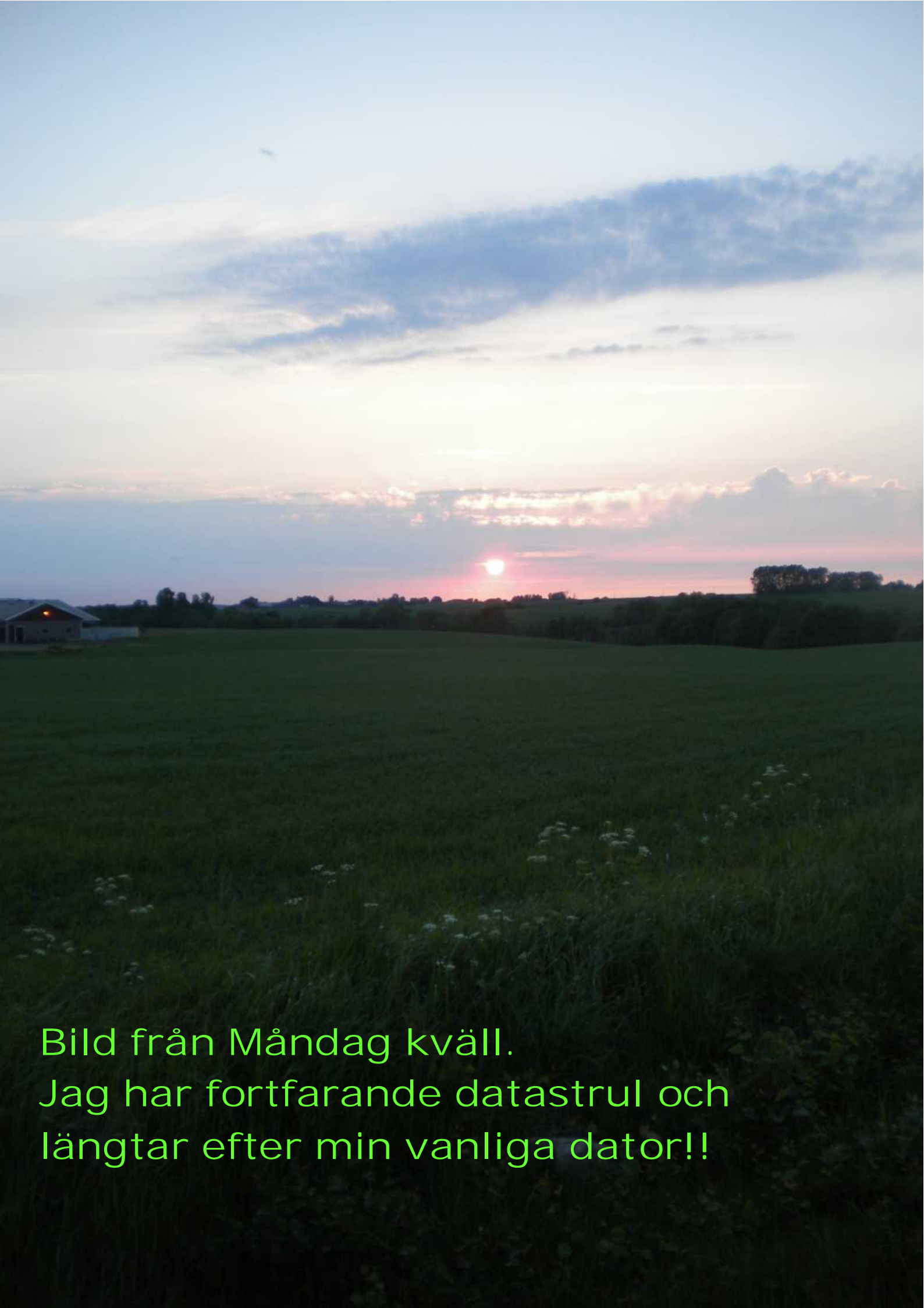
Bild från Måndag kväll. Jag har fortfarande datastrul och längtar efter min vanliga dator!!