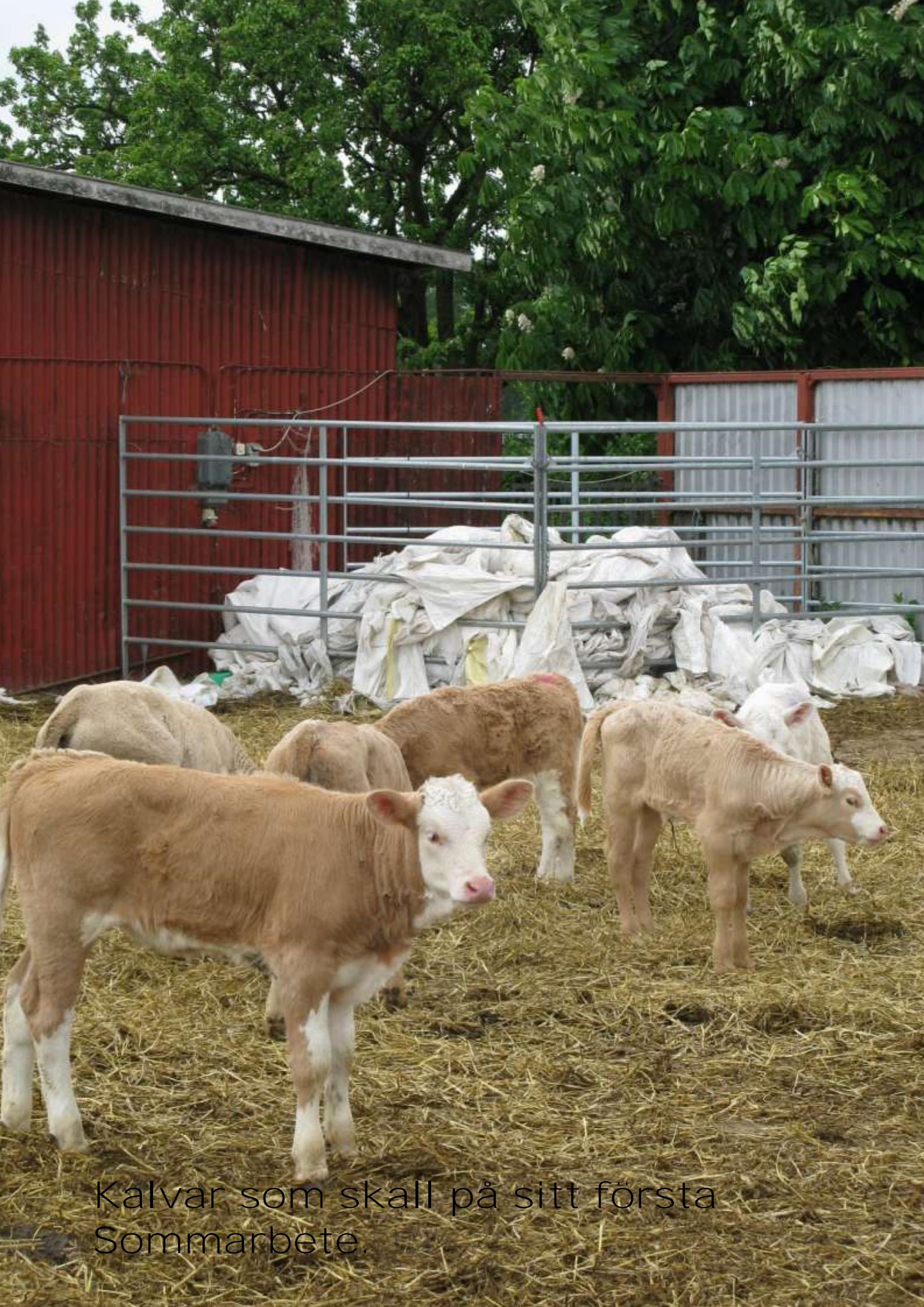
Kalvar som skall på sitt första Sommarbete.