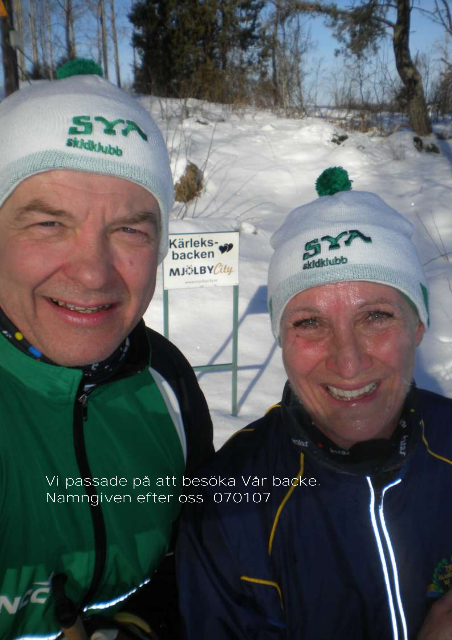
Vi passade på att besöka Vår backe. Namngiven efter oss 070107