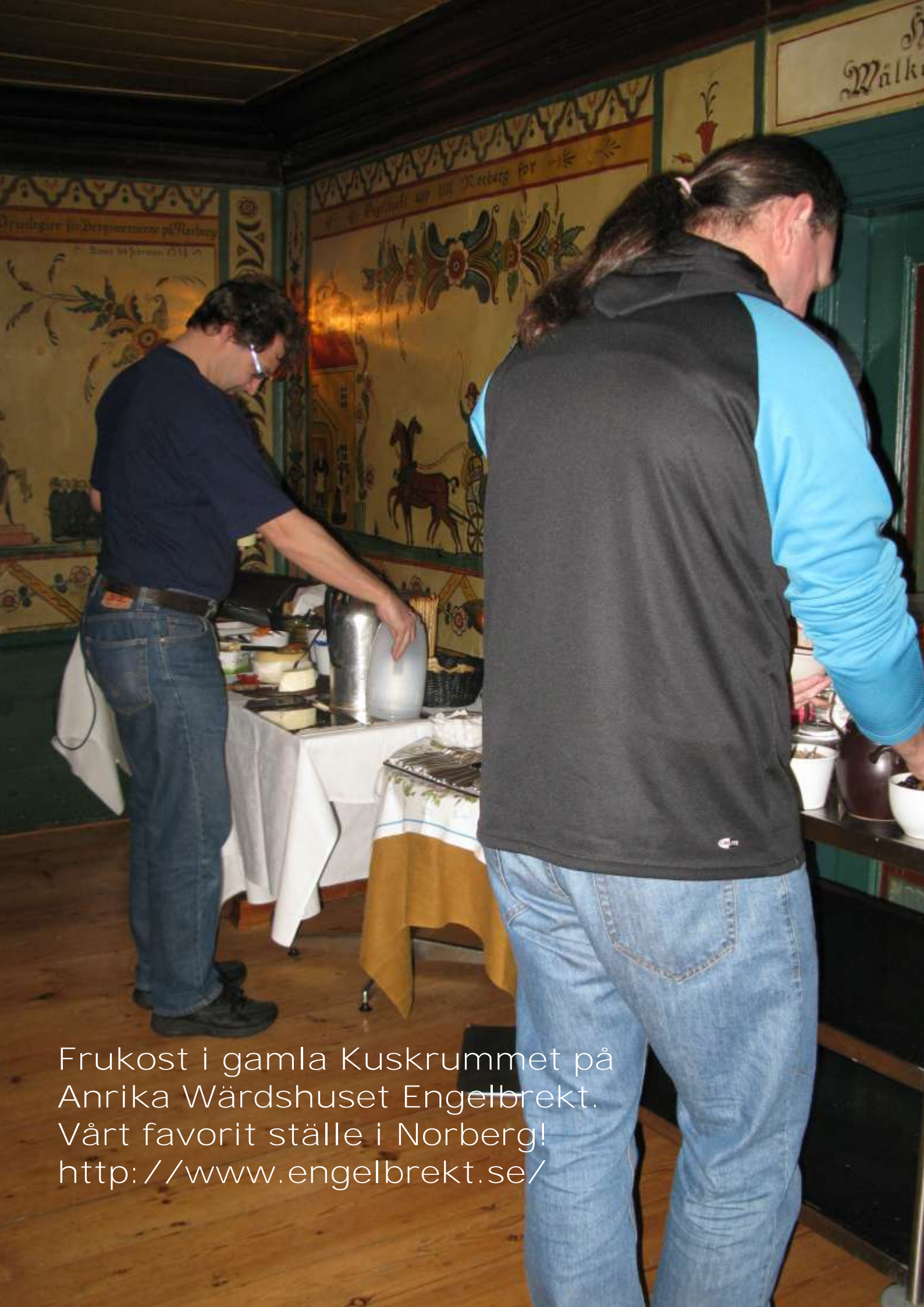
Frukost i gamla Kuskrummet på Anrika Wärdshuset Engelbrekt. Vårt favorit ställe i Norberg! http://www.engelbrekt.se/