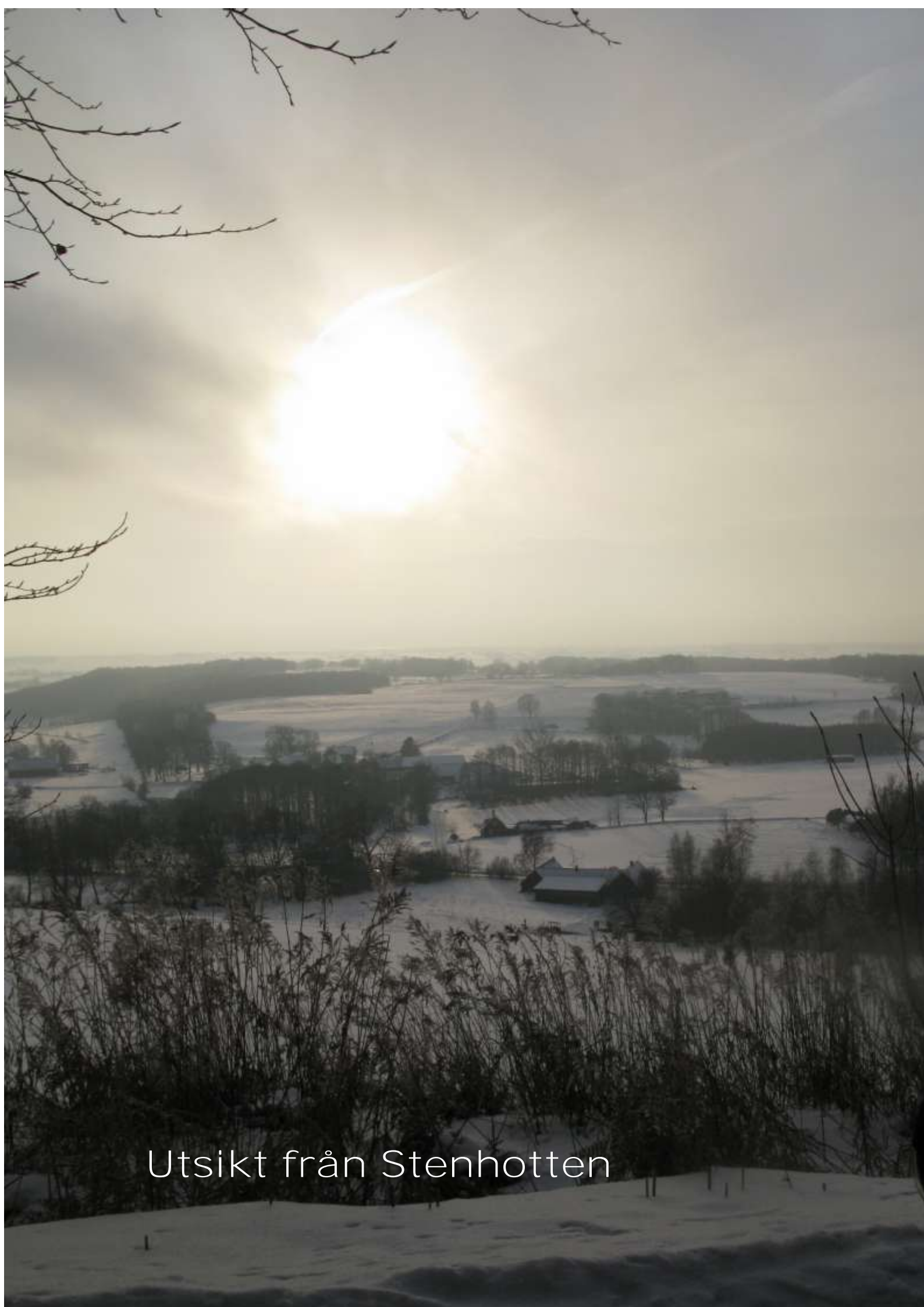
Utsikt från Stenhotten