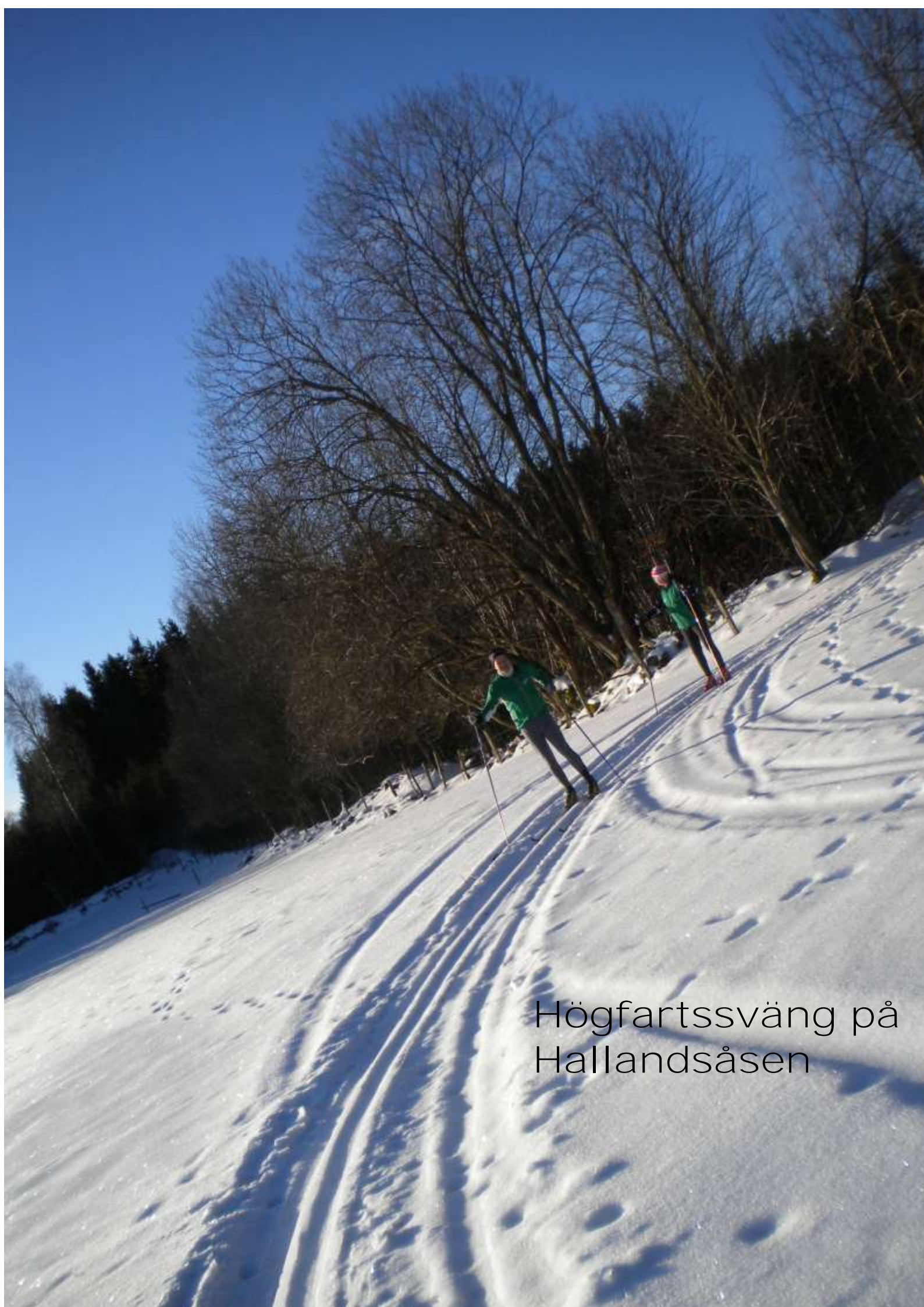
Högfartssväng på Hallandsåsen