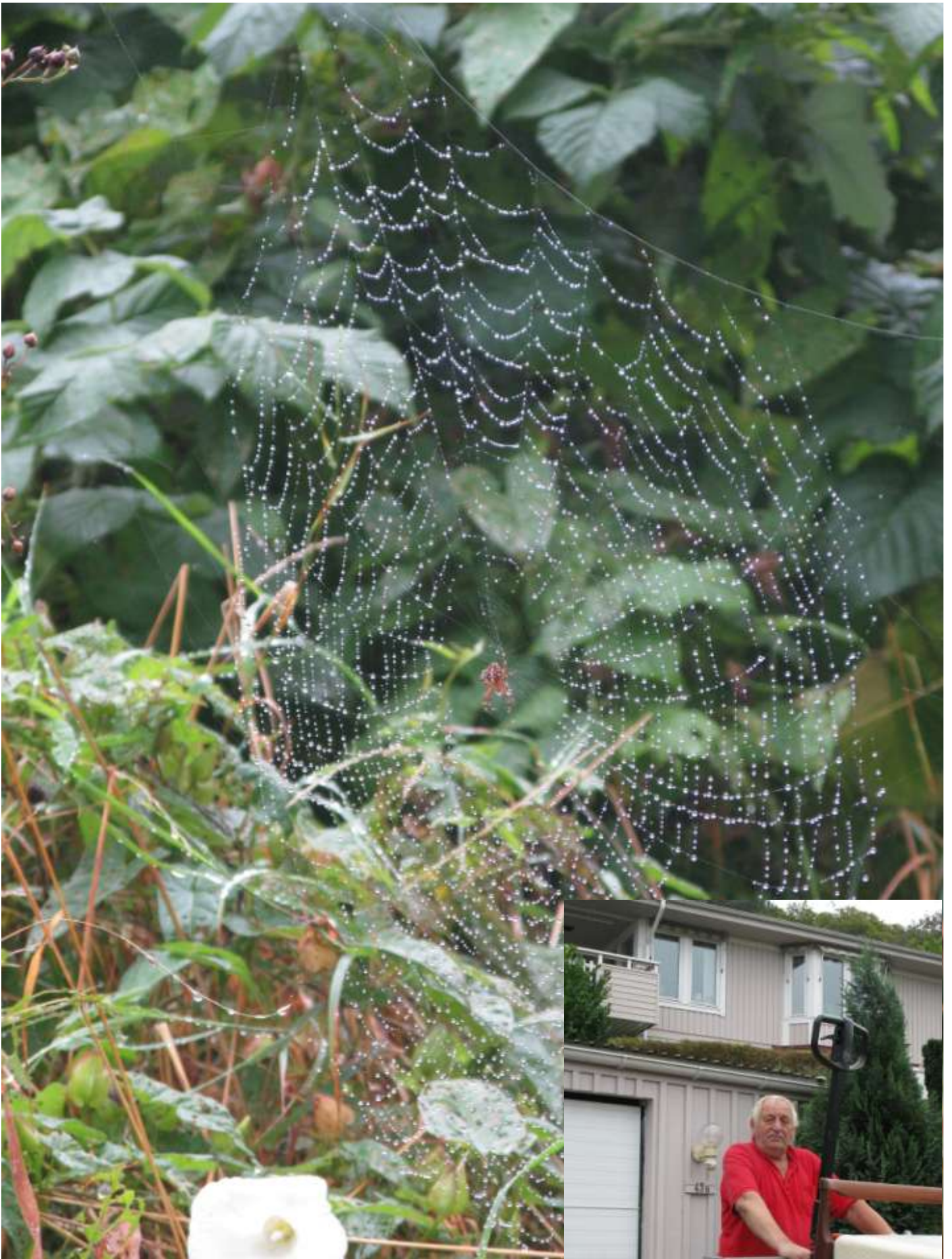
Spindeln och Stig har idag varit flitiga.