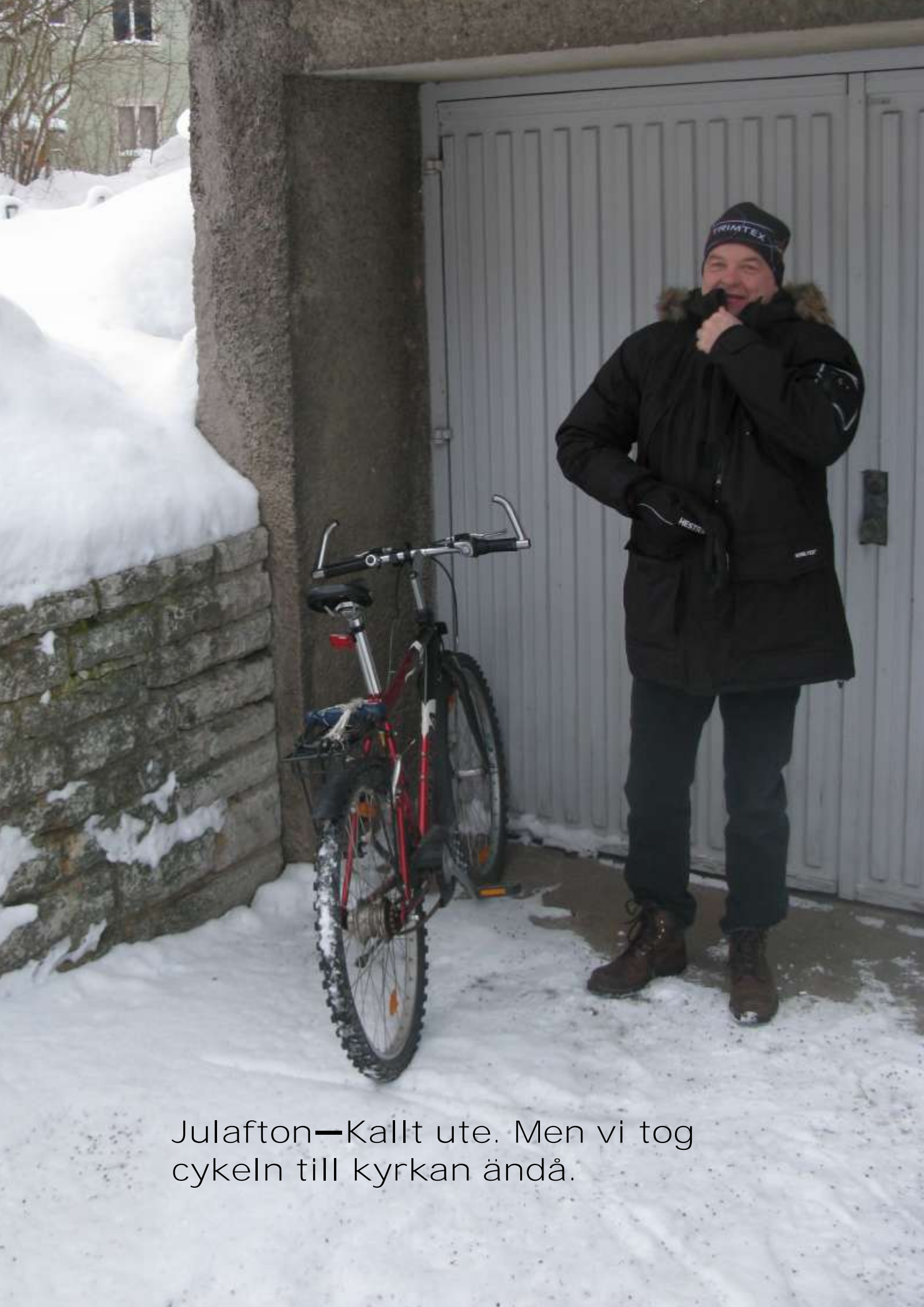
Julafton—Kallt ute. Men vi tog cykeln till kyrkan ändå.