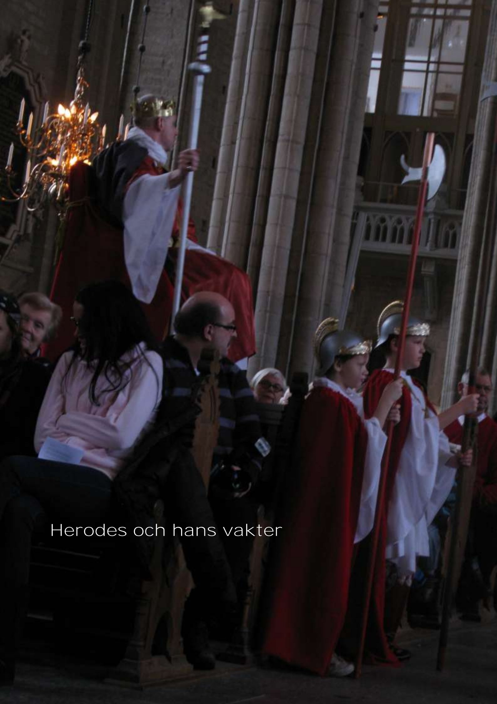
Herodes och hans vakter