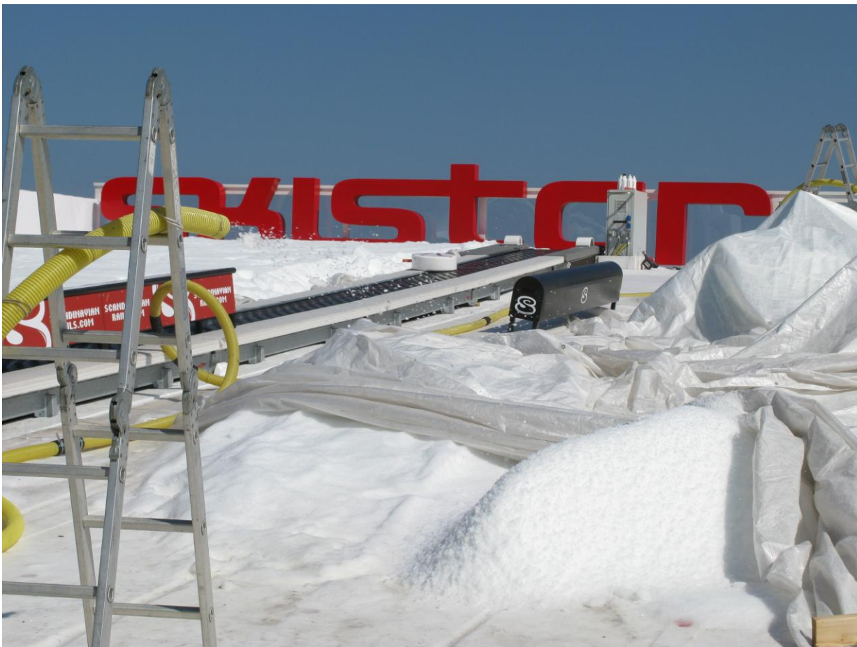
Snökanonen var igång på morgonen, men vi avvaktar med skidåkningen. 😊