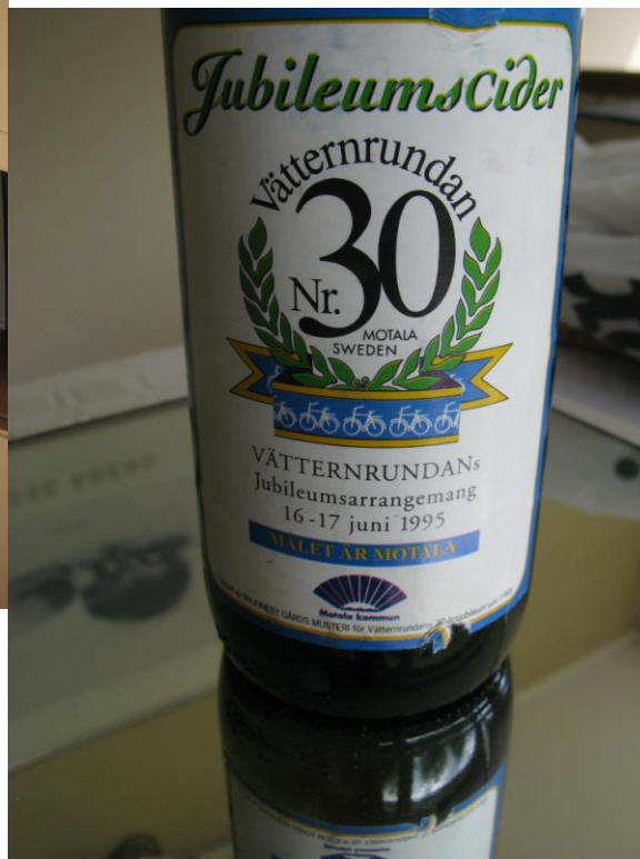
Vad bjuder du för en flaska cider från Vättern Rundan1995?