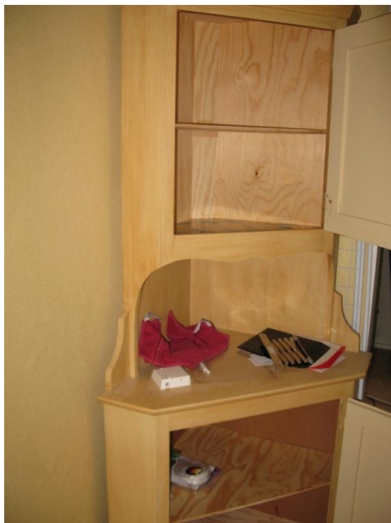
Efter förmiddagen i Båstad var det dags att ta itu med dagens beting. Vi skulle fortsätta att tömma ut från Vallmostigen. Massor med fynd.....