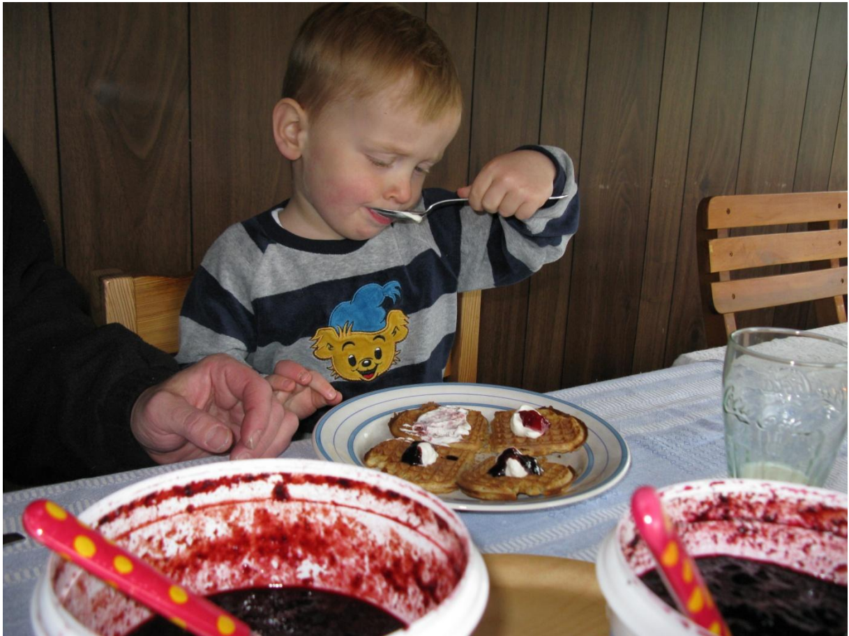
Efter arbete ute fick vi kalasa på våfflor. Jättesmaskigt!

En stor uppgift kvar denna helg. Kosläpp på åsen.