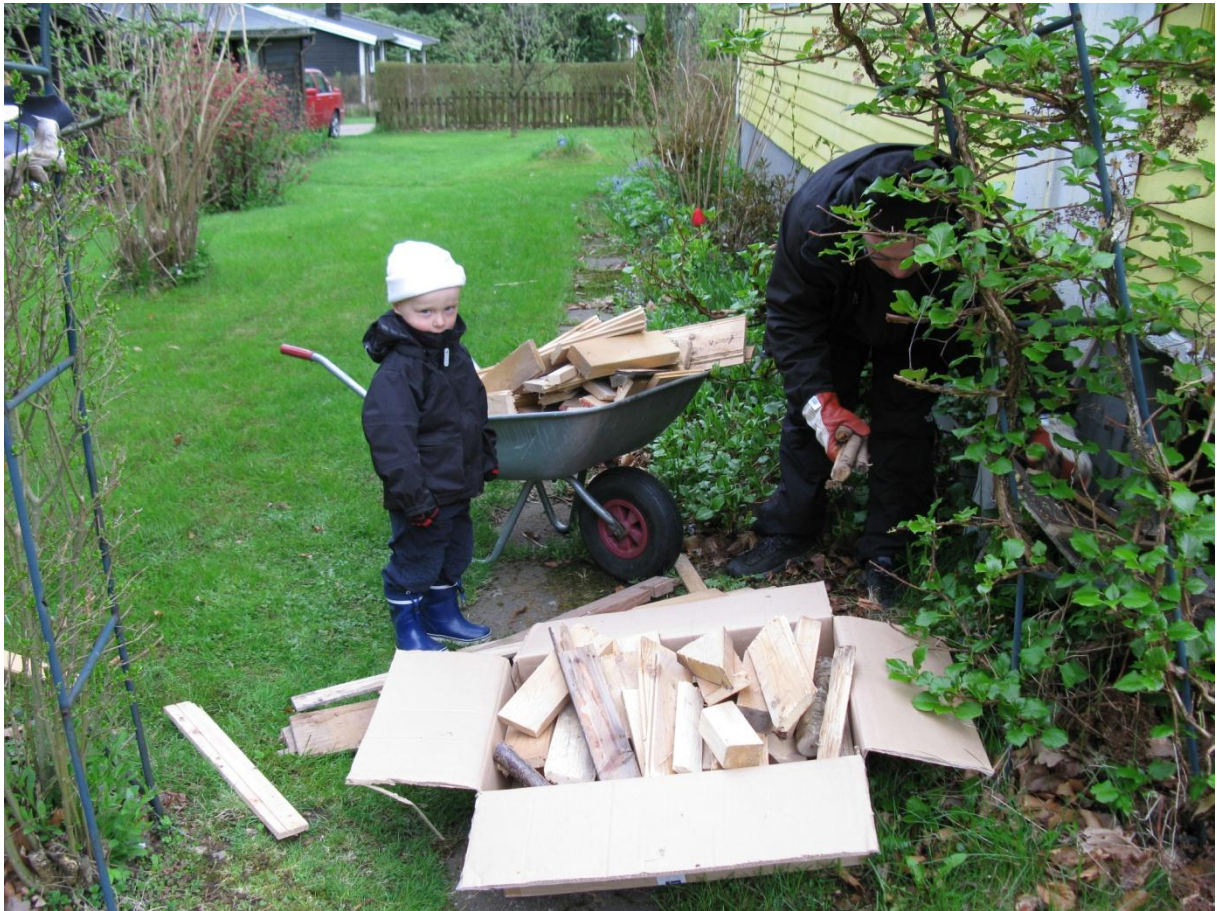
Nästa uppgift var att ta fram trädgårdsmöblerna på Rosa. Det kan ju bli varmare..... Hoppas Vi!