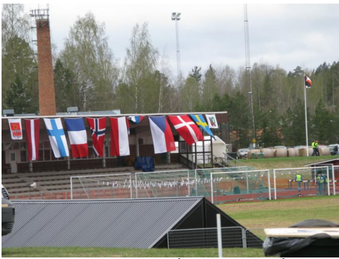
Tältstaden runt på TC ser ut som på Femdagars.

1 Maj i ett blåsigt och lite kallt Finspång. Flaggorna vajar för 10 mila orienteringen. Lite morgonfika för att värma upp oss.