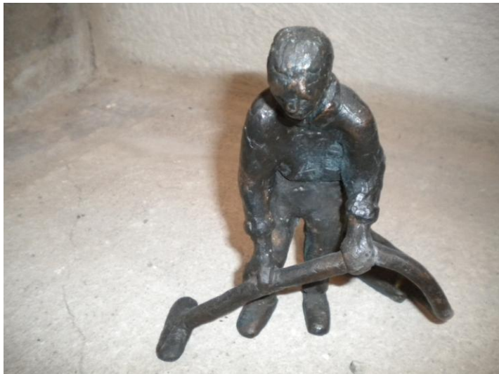
Ateljén ligger precis vid Vegeås mynning. Underbar plats!