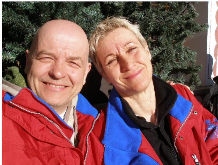
Bild från fikan på eftermiddagen.