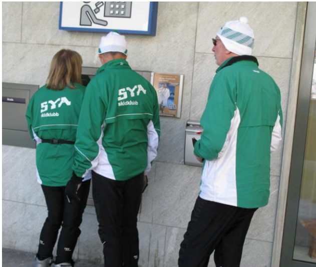
Semesterkö vid bankomaten. Vi behöver Schweizer pengar.