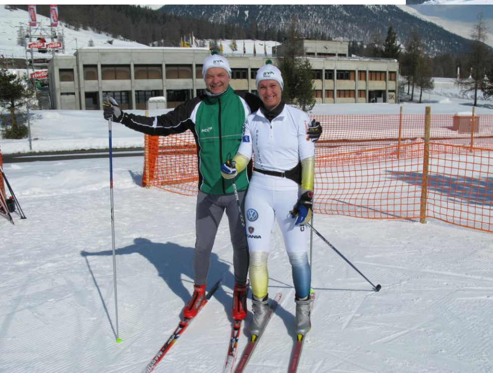
Redo att kolla spåret baklänges.